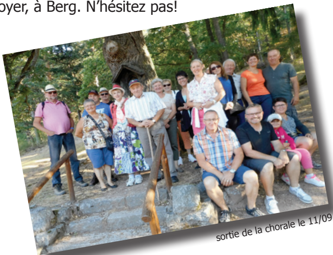
sortie de la chorale le 11/09

• Pourquoi ne pas venir participer aux rencontres hebdomadaires de la chorale. Bien entendu, nous participons à certaines célébrations, mais le plus important lors des répétitions est de décompresser, de se déconnecter et de s'ouvrir. À qui? À soi d'abord, aux autres, car sans la voix de mon voisin, ma voisine, la mélodie d'ensemble sera différente. Des moments de partage, de fraternité. Nous nous retrouvons tous les jeudis soir à 20h au foyer, à Berg. N'hésitez pas!