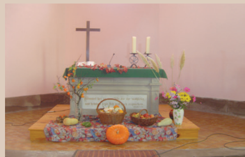
L'église de Rexingen richement décorée pour la fête des Récoltes.

• Nous sommes encore au mois de septembre, mais la période de l'Avent est à nos portes. RDV le dimanche 27 novembre à 14h à la salle polyvalente de Thal pour notre fête de l'Avent. Les jeunes du catéchisme ainsi que la chorale paroissiale participeront à cet événement. Cordiale invitation à tous. À noter que les calendriers 2017 seront disponibles à cette fête.