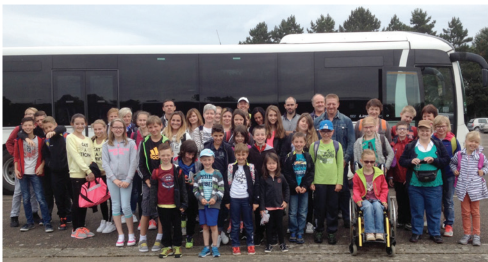
3 juillet: Quelle belle journée au parc Walygator près de Metz!

Pour les cultes dans nos paroisses, veuillez consulter nos pages consistoriales.