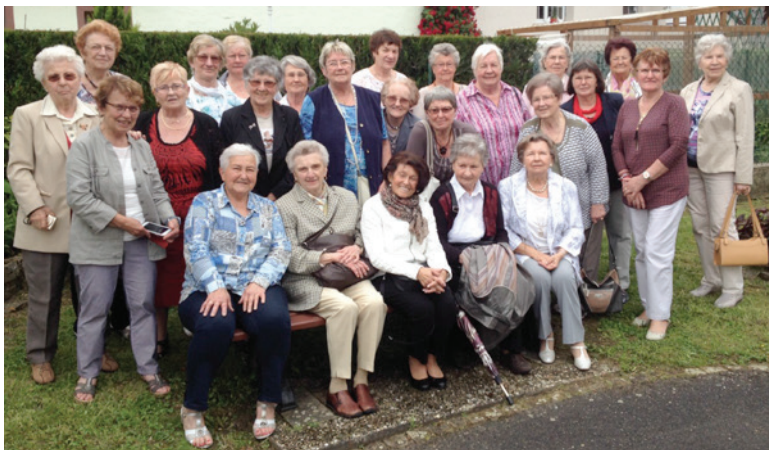
21 juin: Rencontre des ouvroirs de Güdigen et de W-E-H