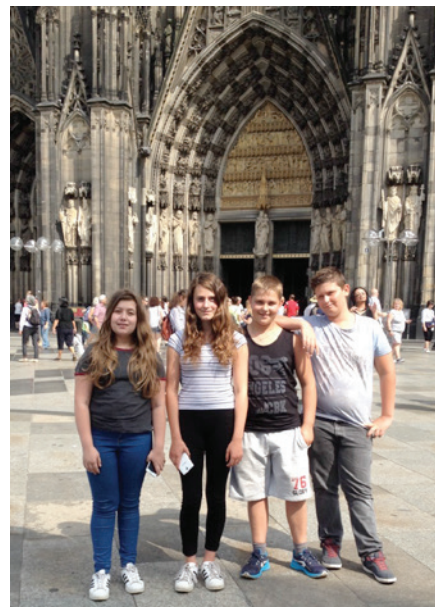
18 - 21 août: Voyage des confirmands en Allemagne