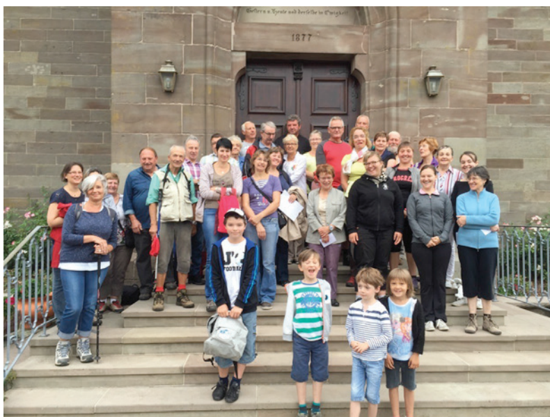
4 septembre: Marche sur le chemin de Saint Jacques de Compostelle (6 personnes de Bischtroff et de Sarreguion manquent sur la photo)