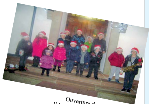
Ouverture du calendrier de l'Avent à Gungwiller Rexingen