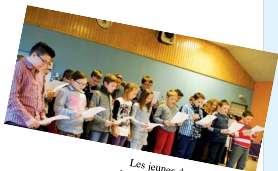
Les jeunes du catéchisme à la fête de l'Avent à Rexingen

• En plus du début de l'hiver, le solstice marque la plus longue nuit de l'année. S'il peut paraître triste à cause, parfois, des intempéries ou du manque de lumière, il ne faut pas oublier qu'à partir du solstice d'hiver les jours rallongent - petitement au début - et que ce que nous pouvons éventuellement fêter à cette date c'est le retour progressif de la lumière ... Les fêtes de Noël qui suivent de peu ce passage significatif ne s'y trompent pas, elles, avec leurs illuminations, leurs couleurs éticellantes, et leurs sapins anoblis par la lumière et l'or !