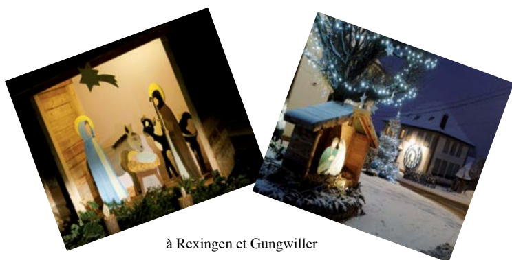
à Rexingen et Gungwiller